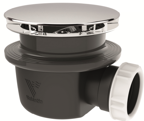
Photo / schéma produit