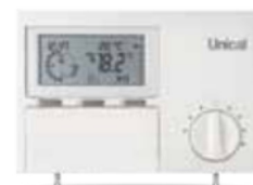
THERMOSTAT D'AMBIANCE programmable ON-OFF