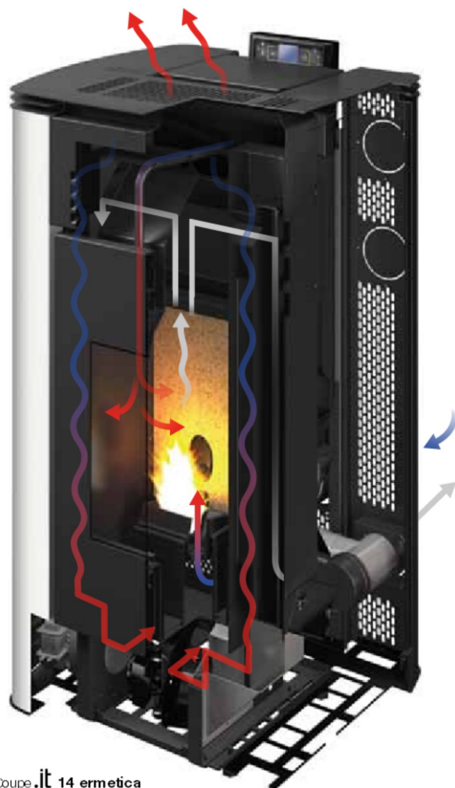
Coupe .it 14 ermetica

Sur toute la gamme .it ermetica il est possible, par une application dédiée, de gérer le poêle à distance avec son smartphone ou sa tablette.