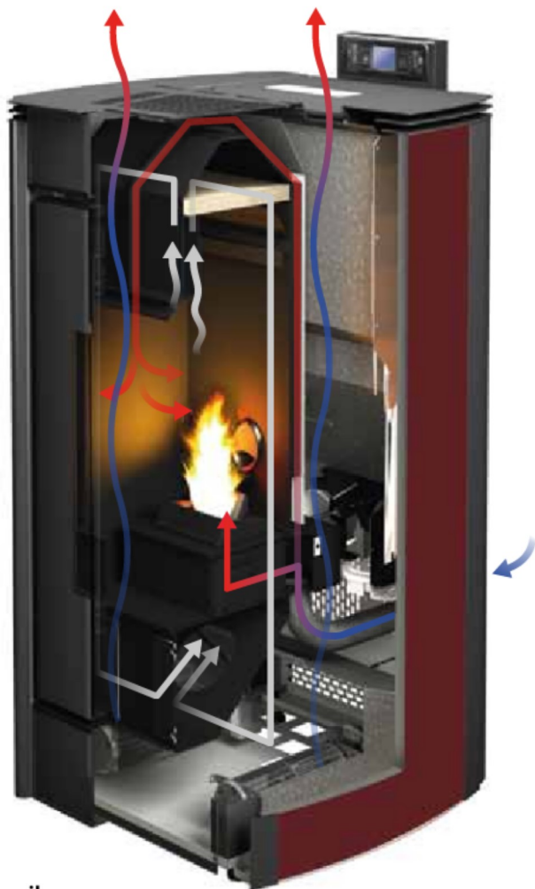
Coupe .it 10,5 ermetica