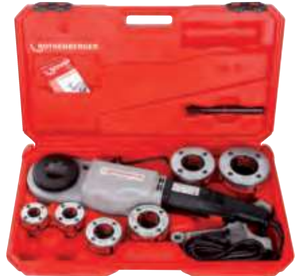
Fig. Ensemble SUPERTRONIC® 2000 (exemple)