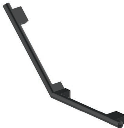
Schéma technique :