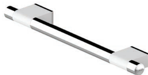
Schéma technique :