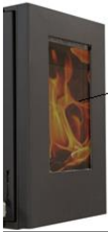
Vitre B1 Muro