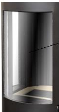
Vitre devant Gabriel B4