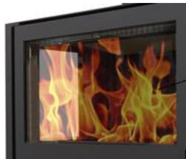
Vitre devant Muro, Vero B00