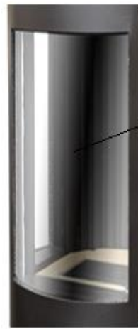
Vitre devant Orio B3