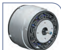
Moteur sur silentbloc