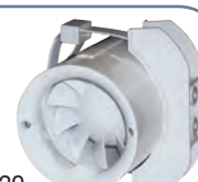
PIE 100/120 Accessoire pour installation murale