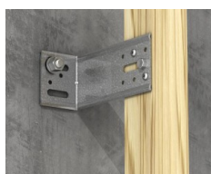
Fixation de chevron