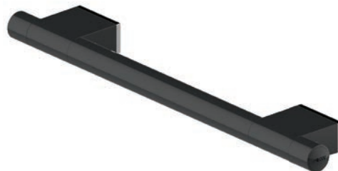
Schéma technique :