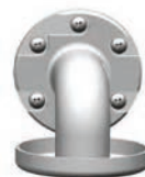
Schéma technique :