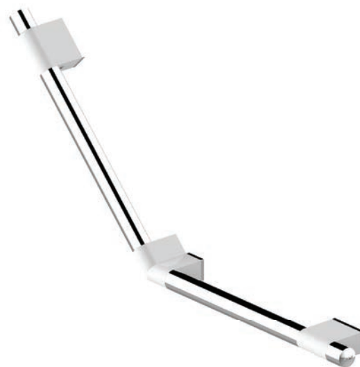
Schéma technique :